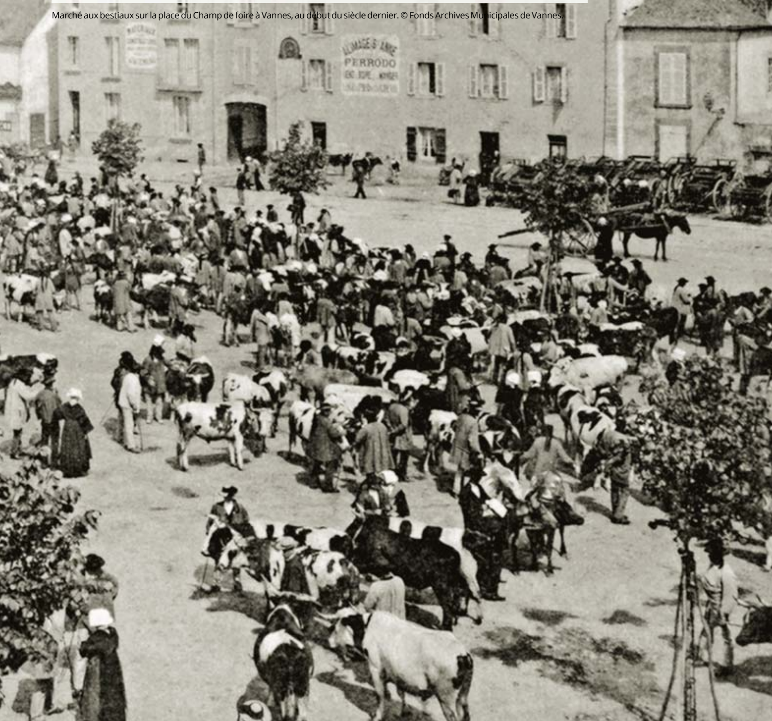
Marché aux bestiaux sur la place du Champ de foire à Vannes, au début du siècle dernier.

Située sur l'emprise de l'ancienne chapelle Saint-Michel et de son cimetière, la place de la Libération, en amont de la caserne de gendarmerie, a pris ce nom en 1964 à l'occasion du 20 e anniversaire de la Libération de Vannes. Avant cela, ce fut un grand verger appartenant aux religieuses de l'Ordre de la Visitation. La Ville de Vannes fit l'acquisition de ce jardin en 1826 pour y installer la foire aux vaches. C'est cette fonction occasionnelle qui a valu à cette place publique d'être dénommée place du Champ de foire, nom qu'elle a conservé jusqu'en 1964.