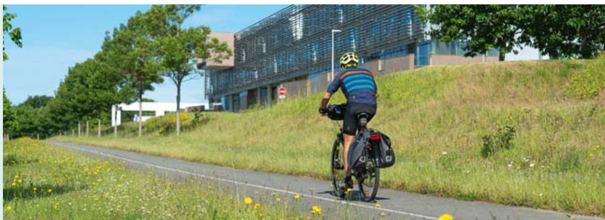
Le compte Facebook de la Ville vous donne désormais rendez-vous, chaque jeudi, avec "Vélo hebdo", la chronique qui vous dit tout sur le vélo.

Nouveaux parcs urbains. Grâce au partenariat que la Ville a conclu avec la société vannetaise Imagina, la promenade dans les nouveaux parcs du Pargo et de Beaupré-La Lande peut s'agrémenter d'une visite connectée. En activant le Bluetooth de votre smartphone au passage des bornes interactives installées dans ces deux parcs, vous continuez de vous balader tout en consultant des vidéos sur des sujets en lien avec votre visite. ●