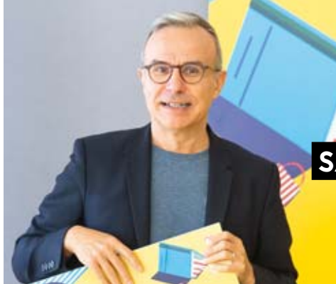
Philippe Besson, Prix littéraire 2021 de la Ville de Vannes pour Le dernier enfant (Julliard).