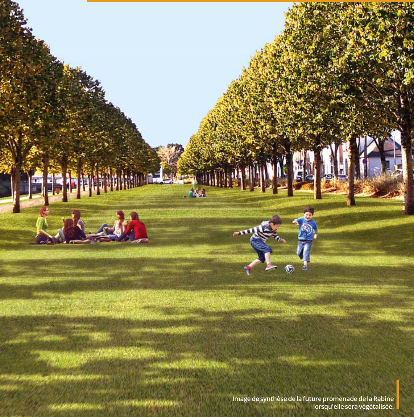
Image de synthèse de la future promenade de la Rabine lorsqu'elle sera végétalisée.

Au printemps prochain, la promenade de la Rabine, lieu emblématique de la ville de Vannes longeant la rive droite du chenal portuaire et du bassin à flot, aura changé de visage. Cette grande allée de près de 2 km de long, entièrement gazonnée et bordée par des arbres d'alignement nouvellement plantés, proposera aux promeneurs un nouvel espace de respiration et de détente aux portes du centre-ville.